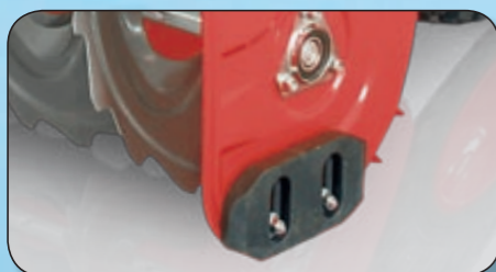
nastavitelné lížiny z odolného polymeru chránící dlažbu před poškrábáním