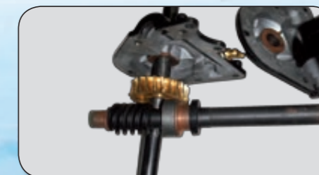
masivní převodovka s mazničkou