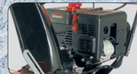
zimní motor LONCIN s elektrickým startováním