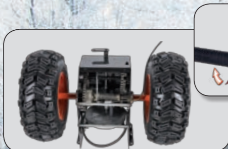
system snadného zatáčení pomocí mechanismu „EASY TURNING“