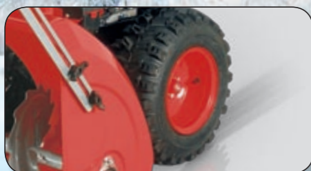
speciální zimní pneumatiky se vzorkem SNOWGRIP