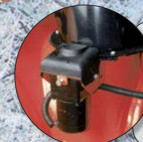
elektrické ovládání nastavení komínku