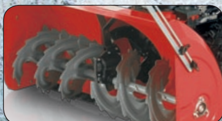
masivní zpevnění převodovky šneku a masivní ozubený šnek AGGRESSIVEAUGER