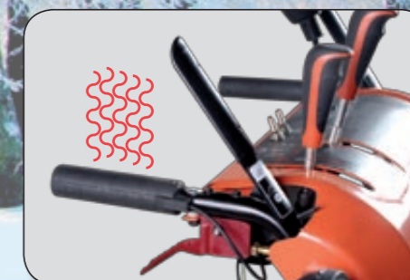
ergonomické uspořádání ovládacího panelu + aretace chodu šneku + vyhřívané rukojeti